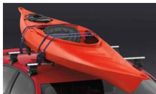
Kajak festingar: 32.500 kr.