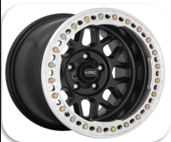
KMC 235 GRENADE CRAWL BEADLOCK svartar eða póleraðar

8.5x17 - svartar eða dökkgráar Verð: 299.600 kr. 4stk.