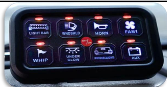
AUXBEAM 8 takka rofaborð Sjálfvirk birtulækkun og hækkun