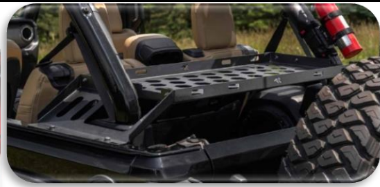
RUGGED RIDGE - skotthilla Götuð hilla, tilvalið að strappa niður hluti