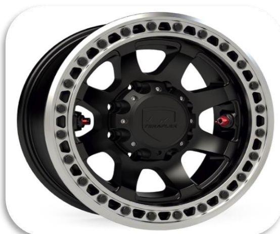
TERAFLEX OLYMPUS BEADLOCK svartar eða póleraðar

10x17 Verð: 638.800 kr. 4stk. 12x17 Verð: 988.800 kr. 4stk.