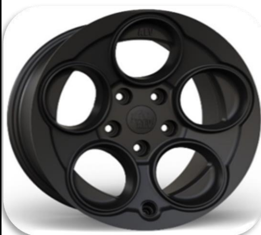
AEV SAVEGRE II

10x17 - svartar eða dökkgráar Beadlock hringur er dökkgrár eða silfur Verð: 479.200 kr. 4stk.