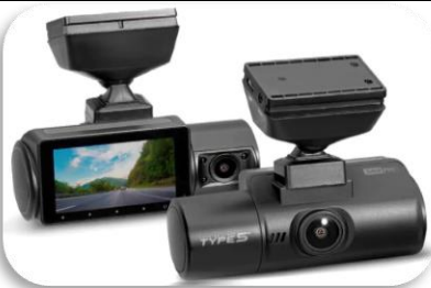
Upptökumyndavél frá TYPE S TYPE S S402 Pro Ultra HD 4K Dual View / 2K Cabin View