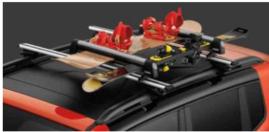
Skíða/brettafest.: 49.900 kr.