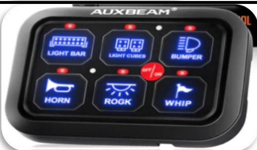
AUXBEAM 6 takka rofaborð