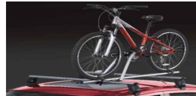
Hjólafestingar: 35.000 kr.

Hér fyrir neðan má sjá nokkrar vinsælar leiðir, vinna innfalinn í breytingarpökkum: