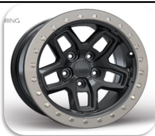
AEV BORAH BEADLOCK

8.5x17 - svartar eða dökkgráar Hægt að fá Protection hringi á felgur Verð: 319.600 kr. 4stk.