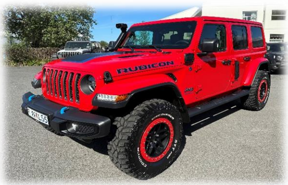
35" breytingar frá 608.339 kr. Margar útfærslur í boði.