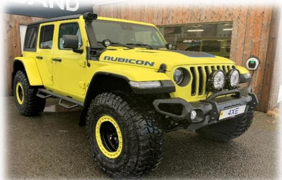
40" breytingar frá 3.082.470 kr. Margar útfærslur í boði.

ÍS BAND framkvæmir allar breytingar á sjálfir á eigin breytingarverkstæði.