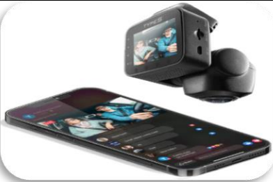
Upptökumyndavél frá TYPE S TYPE S P100 Plus Smart 360 1080P - Live Streaming