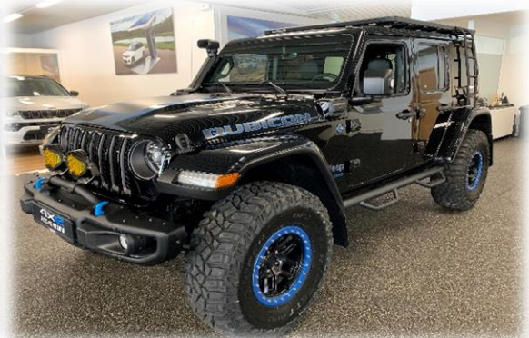
37" breytingar frá 1.526.526 kr. Margar útfærslur í boði.