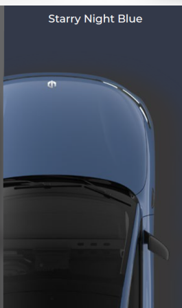
Starry Night Blue