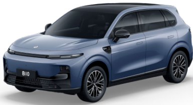
Starry Night Blue