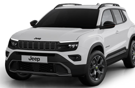
SNOW - HVITUR UPLAND | OVERLAND