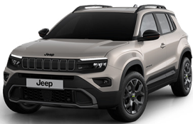
STONE - LJÓSGRÁR UPLAND | OVERLAND