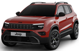
RUBY - RAUBUR UPLAND | OVERLAND