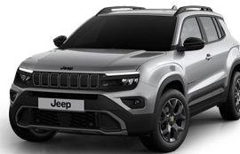
GRANITE - DÖKKGRÁR UPLAND | OVERLAND