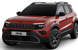
RUBY - RAUBUR - SVART ÞAK UPLAND | OVERLAND