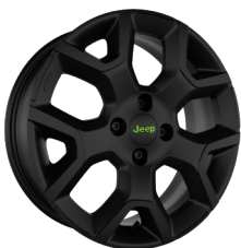
17" ÁLFELGUR | UPLAND / OVERLAND