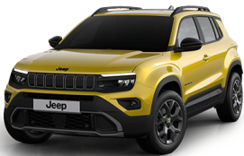
SUN - GULUR UPLAND | OVERLAND