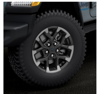
NÝJAR 17" ÁLFELGUR

Að upplifa ævintýri hefur aldrei verið eins þægilegt. Nýr Wrangler Rubicon 4xe Plug-in Hybrid er með torfærmyndavél með útsýni að framan og aftan, sem tryggir hámarks nákvæmni við allar akstursaðstæður.