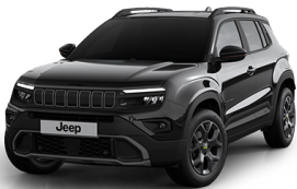
VOLCANO - SVARTUR UPLAND | OVERLAND