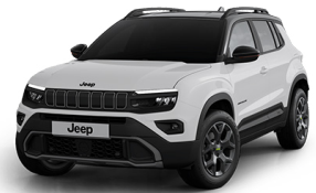
SNOW - HVITUR - SVART ÞAK UPLAND | OVERLAND